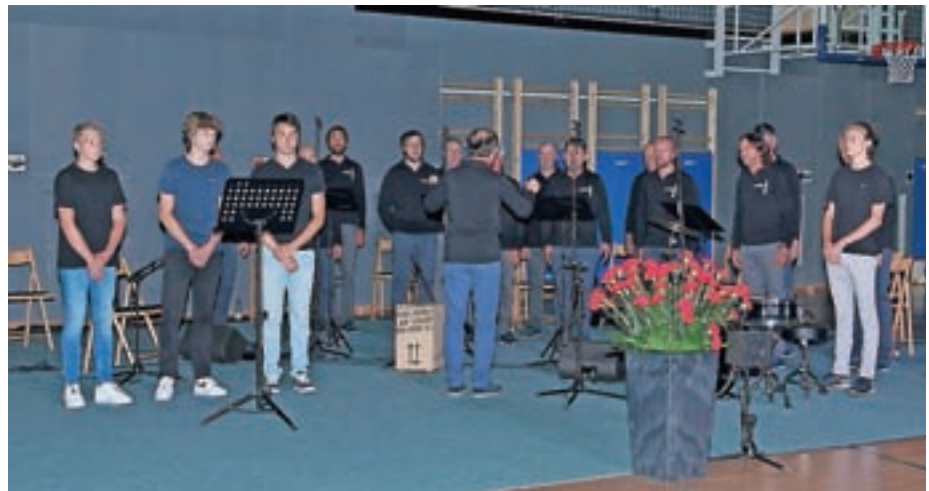
Dan državnosti in tridesetletnico samostojnosti Slovenije so v občini Žiri letos zaznamovali s prireditvijo v novi športni dvorani.

Tako epidemija kot tudi drugi svetovni dogodki pa nam po županovih besedah ponovno potrjujejo, da imeti lastno državo ni samo po sebi umevno. "V krizah se še bolje vidi, kako pomembne so