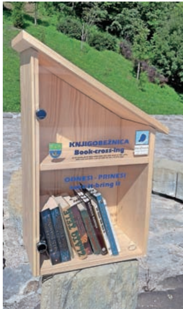
Knjigobežnice so našle mesto tudi v Žireh.

Knjigobežnice se pri nas pojavljajo že od leta 2011, zdaj pa smo jih postavili tudi v Žireh, in sicer eno v centru Žirov in